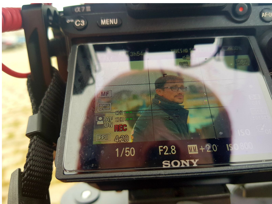
Image : Durant la période de tournage, un cameraman professionnel de l'équipe LDV production a pris congé afin de se rendre disponible tout le long du parcours. Nous avons tourné avec du matériel photographique haut de gamme, des micros-cravates de qualité et avec un drone.

Simple dans les questions, simple dans les réponses pour une compréhension globale. Le tournage s'est réalisé dans la simplicité afin de rendre ce documentaire accessible au plus grand nombre. Nos questions étaient spontanées afin que nos interviews soient les plus intimistes possibles.